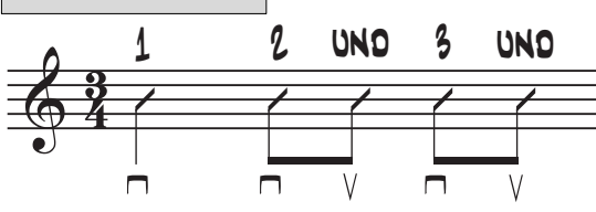
9. Groove 3/4 Takt