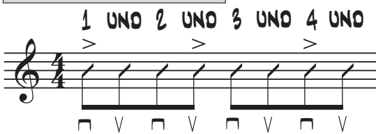
4. Groove mit Betonungen