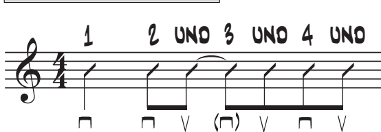
3. Groove mit Haltebogen