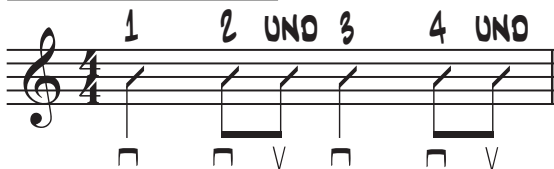
1. Standard Pop-Rock