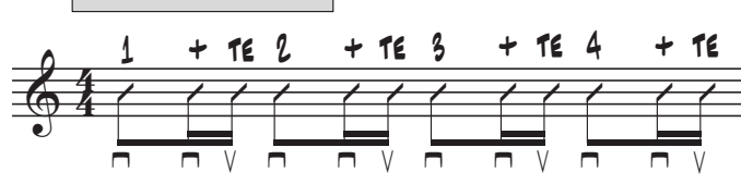
7. 16tel - Groove 2