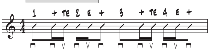
6. 16tel - Groove 1